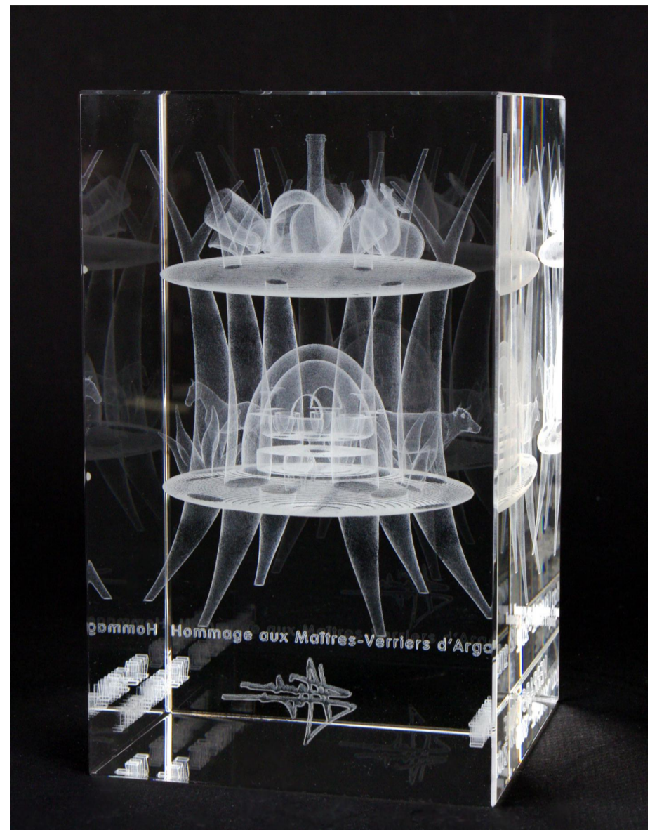
VERRARGONNE version 1 2012 - réalisation 2014 cristal gravé au laser en 3D